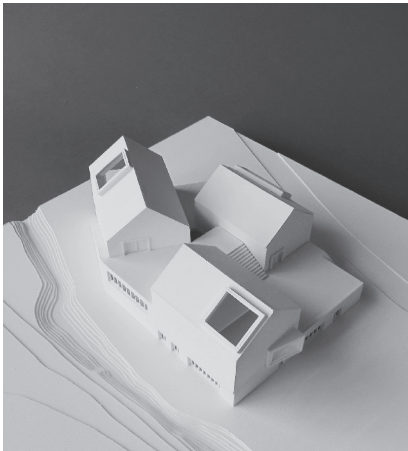
Lokalhistorisk museum, Jøssingfjord, Norge, 2011. Næste opslag: Mindesmærke for døde sejlere WW2 Mindelunden, Charlottenlund, København, 2016.

Local History Museum, Jøssingfjord, Norway, 2011. Next page: Memorial for dead seamen WW2 Mindelunden, Charlottenlund, Copenhagen, 2016.